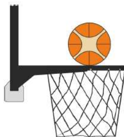
Figura 2 - Palla a contatto dell'anello

31-11 Precisazione - Un'interferenza è commessa dal difensore o dall'attaccante durante un tiro a canestro su azione allorché un giocatore tocca il canestro o il tabellone, mentre la palla è a contatto con l'anello ed ha ancora la possibilità di entrare a canestro.