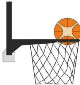
Figura 3 - Palla dentro il canestro

31-17 Precisazione - Si ha una violazione per interferenza se un giocatore difensore tocca la palla mentre questa è dentro il canestro.